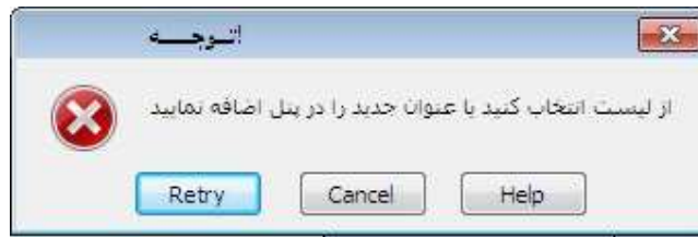
شکل(10)-خطا در درج حساب معین

این هشدار به این معناست که عنوان مورد نظر اشتباه تایپ شده است و یا در برگه پل، موجود نیست و باید تعریف شود.